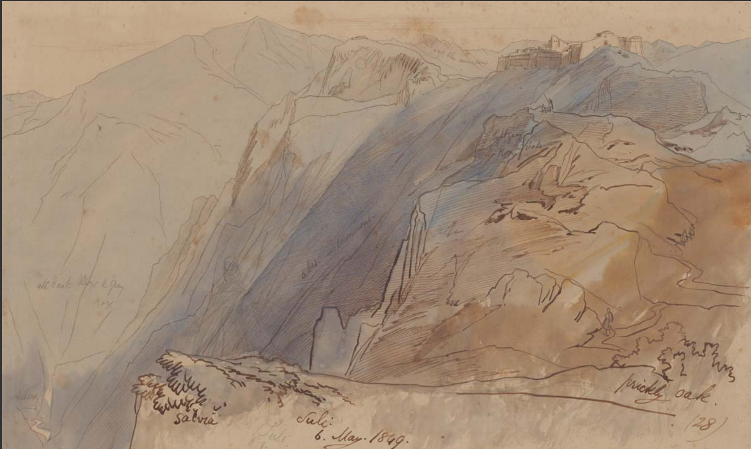
Το κάστρο της Κιάφας και το φαράγγι του Αχέροντα 6 Μαΐου 1849

Σέπια, αραιό μελανό και μπλε υδρόχρωμα πάνω από γραφίτη σε χαρτί