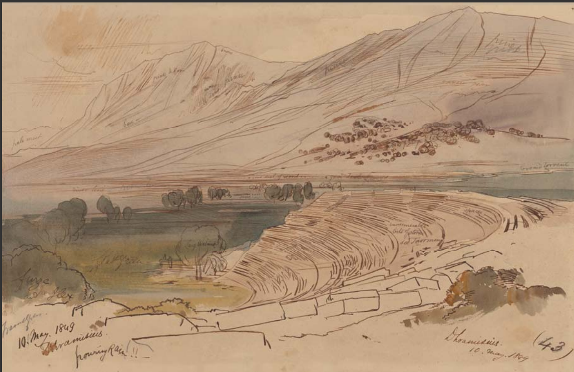
Το θέατρο στους Δραμεσιούς (Δωδώνη)