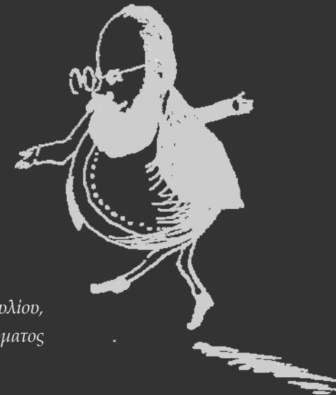
Οδοιπορικό του Edward Lear στον ευρύτερο θεσπρωτικό χώρο (1849, 1856, 1857)

Η έκθεση έχει ως στόχο να παρουσιάσει στο κοινό το σχετικά άγνωστο έργο του Άγγλου ζωγράφου, ποιητή και περιηγητή Edward Lear (1812 - 1888) για τον ευρύτερο θεσπρωτικό χώρο, από την Πάργα έως το Βουθρωτό και από τους Φιλιάτες έως τη Δωδώνη, τον οποίο εκείνος περιηγήθηκε στα 1849, 1856 και 1857. Στο σύνολο των γνωστών, μέχρι σήμερα, έργων του Lear για την περιοχή συγκαταλέγονται περισσότερα από 40 σχέδια, υδατογραφίες, λιθογραφίες και ελαιογραφίες, που ζωντανεύουν με φωτογραφική λεπτομέρεια και ποιητική διάθεση τους τόπους που τόσο πολύ μάγεψαν τον ευαίσθητο βικτωριανό καλλιτέχνη και μας μεταφέρουν πίσω στον χρόνο προσφέροντας, σαν ένα περιηγητικό αφήγημα, πολύτιμες πληροφορίες για μια Θεσπρωτία που χάθηκε για πάντα.