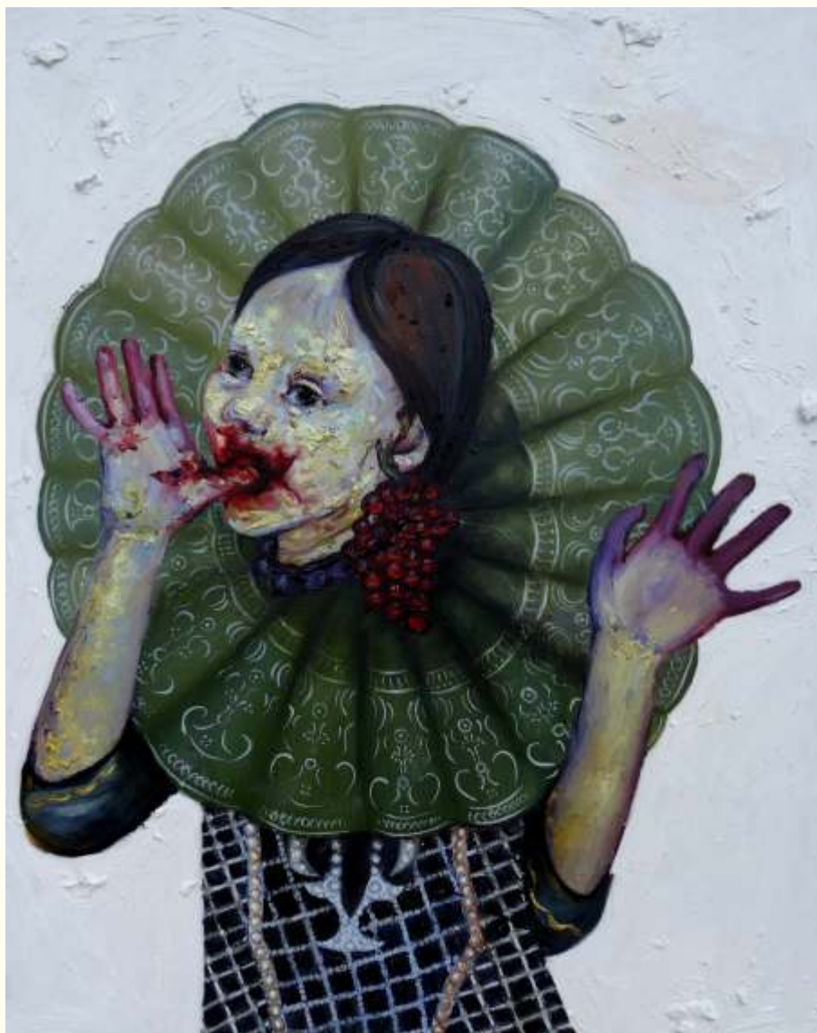
'Ambrosial' λάδι σε μουσαμά, 100 x 80 εκ., 2016 oil on canvas, 100 x 80 cm, 2016