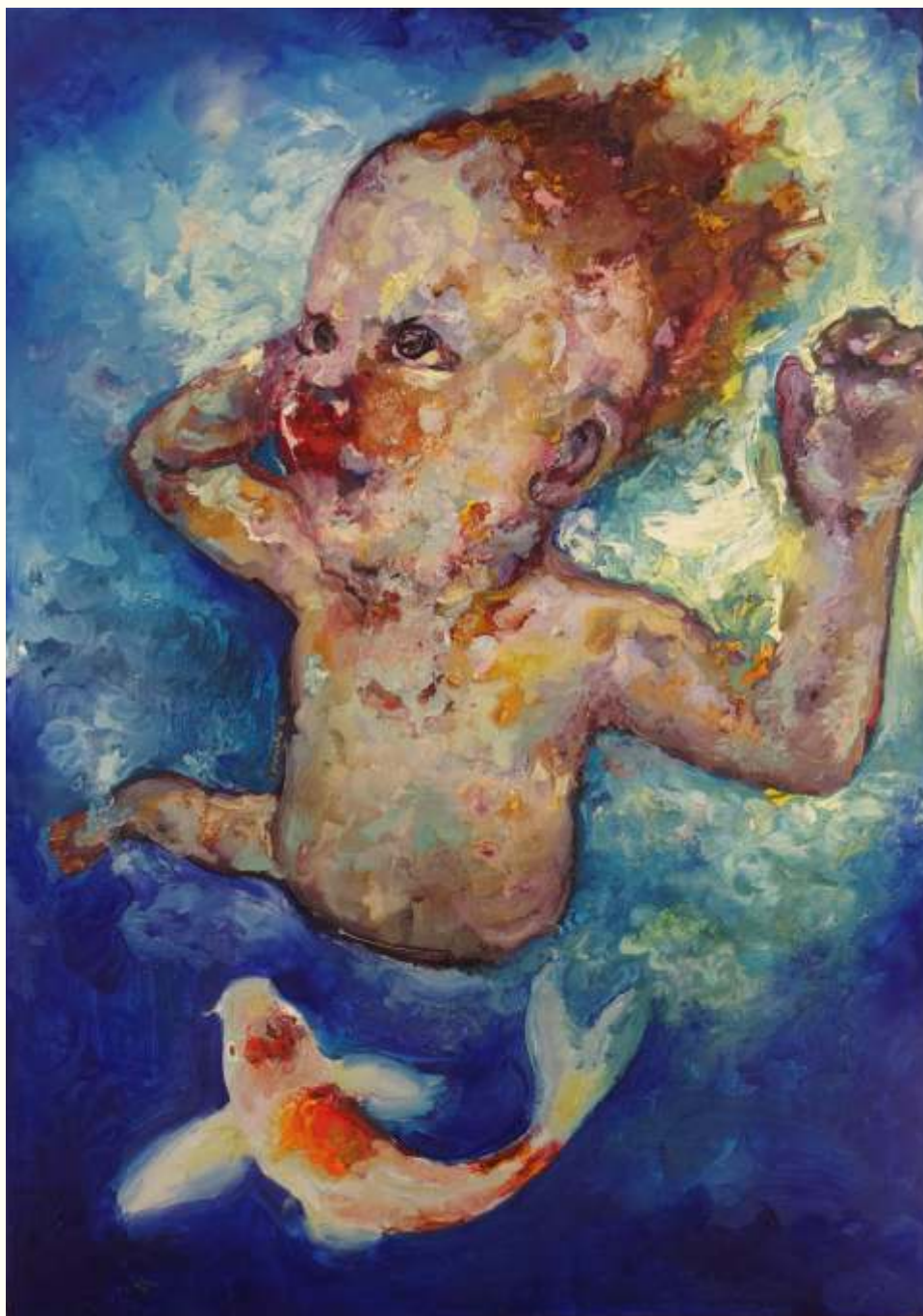
'Magnetizing' λάδι σε μουσαμά, 70 x 50 εκ., 2016 oil on canvas, 70 x 50 cm, 2016