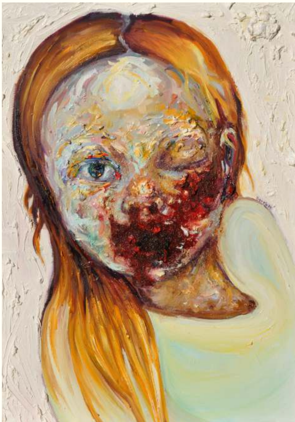
'Sleepy' λάδι σε μουσαμά, 70 x 50 εκ, 2015 oil on canvas, 70 x 50 cm, 2015