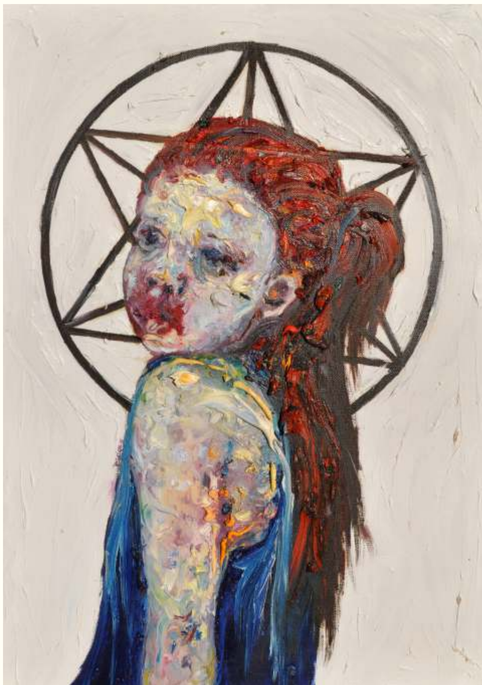
'Go Out Like a Light' λάδι σε μουσαμά, 70 x 50 εκ, 2015 oil on canvas, 70 x 50 cm, 2015