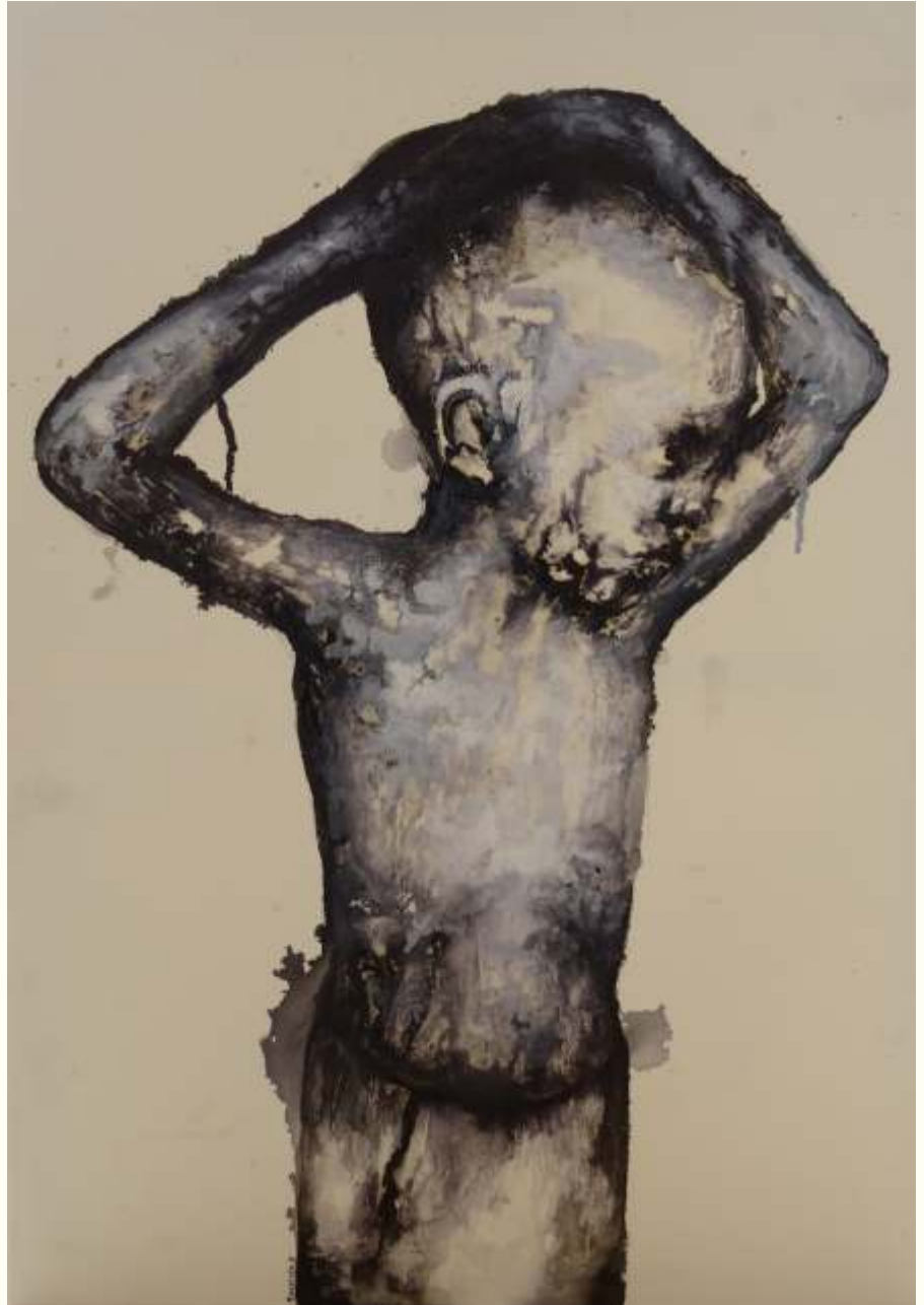
'Unsavory' μελάνι σε μουσαμά, 90 x 65 εκ., 2016 ink on canvas, 90 x 65 cm, 2016