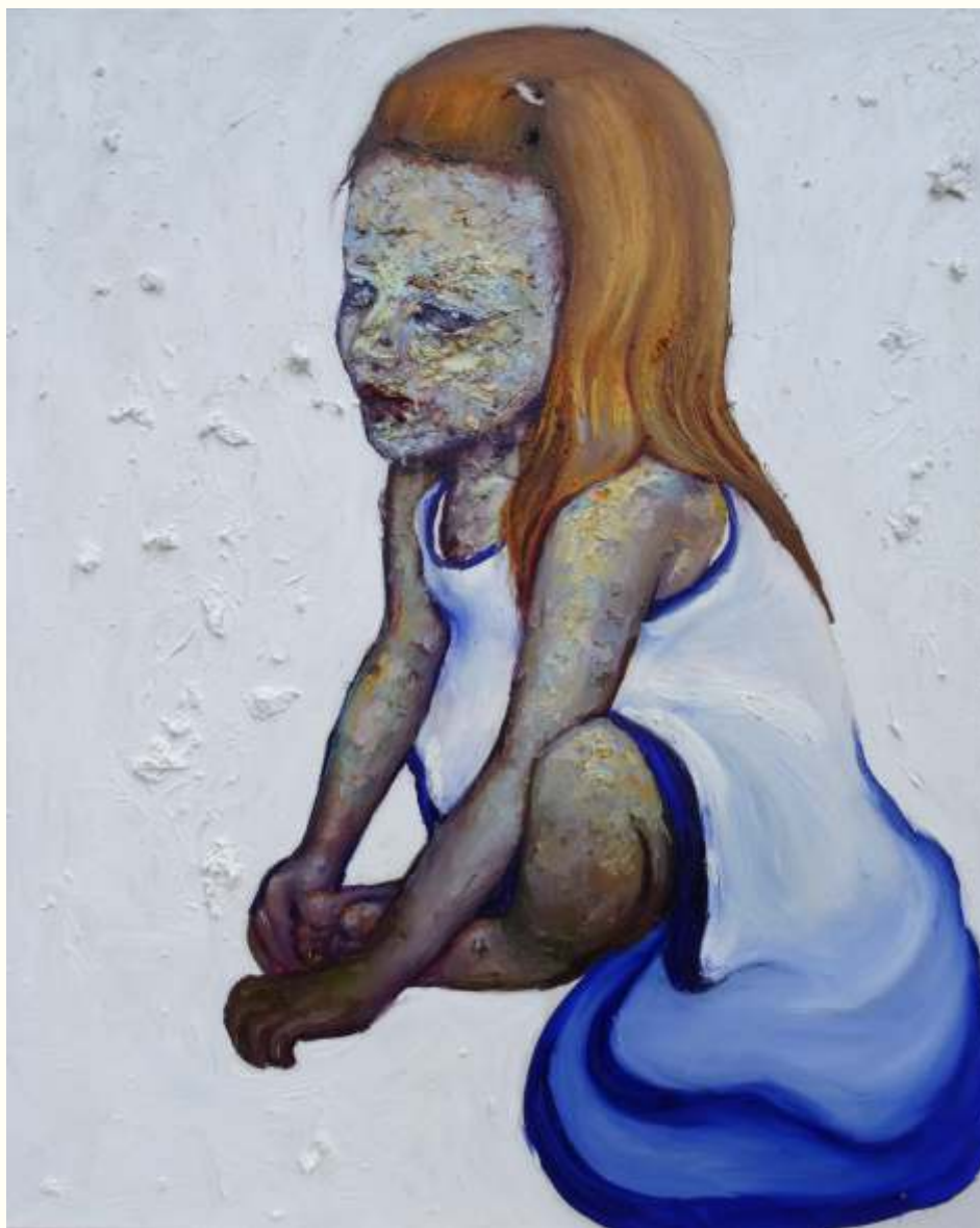
'Sugar-Coated Blue' λάδι σε μουσαμά, 100 x 80 εκ., 2016 oil on canvas, 100 x 80 cm, 2016