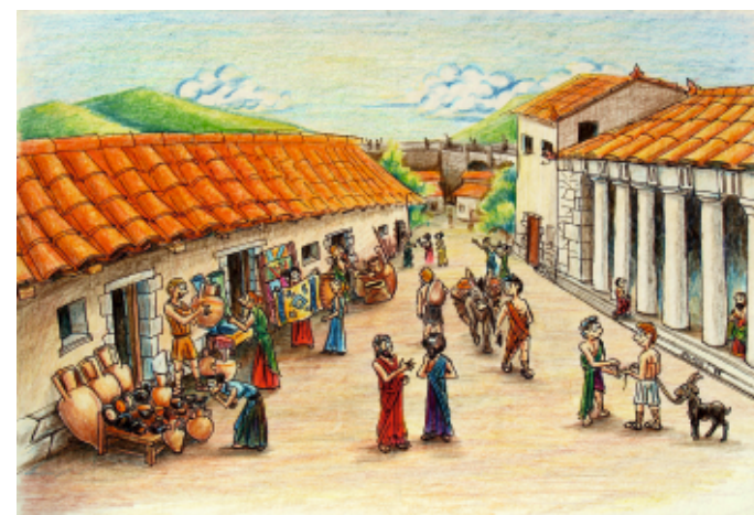
Υποθετική σχεδιαστική αναπαράσταση της αγοράς των Γιτώνων, Θανάσης Τσιπρόφτης

G. Glotz, La travail dans la Grece antique , σελ. 345, 346.