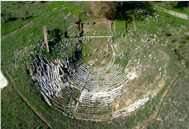
Αεροφωτογραφία του θεάτρου των Γιτάνων.

Θέατρα υπήρχαν και σε άλλες μεγάλες και οργανωμένες πόλεις της αρχαίας Ηπείρου, όπως η Αμβρακία, η Κασσώπη, η ρωμαϊκή Νικόπολη, ο Βουθρωτός, η Φοινίκη, η Βύλλις και η ρωμαϊκή Ανδριανούπολη (τα 4 τελευταία στη σημερινή Αλβανία). Το μεγαλύτερο όμως σε μέγεθος και μνημειακότητα αρχαίο θέατρο της Ηπείρου δεν σχετίζεται με κάποια πόλη, αλλά βρίσκεται στο ιερό του Δωδωναίου Διός, προς τιμήν του οποίου γίνονταν στη Δωδώνη οι αθλητικοί και δραματικοί αγώνες της εορτής των Ναΐων. Η γνωριμία με το θέατρο των Γιτάνων μπορεί να είναι η αφετηρία και αφορμή για να περιηγηθεί κανείς και στα υπόλοιπα θέατρα της σύγχρονης Ηπείρου, στην Αμβρακία (σημερινή Άρτα), τη Νικόπολη, την Κασσώπη και το ιερό της Δωδώνης.