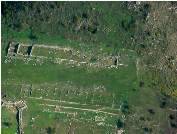
Αεροφωτογραφία της Αγοράς των Γιγάντων

Τέλος, ο τομέας του οικισμού ανατολικά του διατειχίσματος, που συμβατικά ονομάστηκε «Κάτω Πόλη», καλύπτει μια έκταση 100 περίπου στρεμμάτων και περιλαμβάνει ιδιωτικές κατοικίες και κτήρια με πιθανό δημόσιο χαρακτήρα. Ένας πλατύς λιθοστρωμένος δρόμος διέσχιζε το ανατολικότερο τμήμα της κάτω πόλης και κατέληγε σε ευρύχωρη πύλη της οχύρωσης, κοντά στην κοίτη του ποταμού, που στο σημείο αυτό θα πρέπει να φιλοξενούσε λιμενικές εγκαταστάσεις.