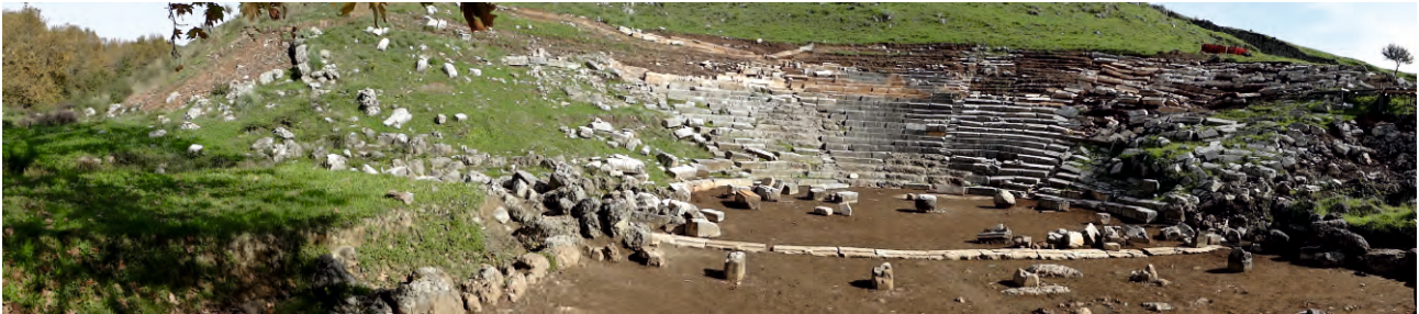
Αποψη της ορχήστρας και του κοίλου του θεάτρου.

Ως έδρα του Κοινού των Θεσπρωτών και των Ηπειρωτών, τα Γίτανα είχαν ανάγκη από την κατασκευή ενός οικοδομήματος κατάλληλου τόσο για τις συνελεύσεις των εκπροσώπων του Κοινού, όσο και για τη διδασκαλία του αρχαίου δράματος. Για τη θέση του θεάτρου επιλέχθηκε η δυτική πλαγιά του υψώματος που φιλοξενεί την αρχαία πόλη, λίγα μέτρα εξωτερικά των τειχών και σε συνάφεια με το πρυτανείο, σε ελάχιστη απόσταση από την κοίτη του Καλαμά. Ένας μνημειώδης λιθόστρωτος δρόμος εξασφάλιζε την άμεση και άνετη πρόσβαση από το πρυτανείο στο θέατρο, το οποίο έμελλε να διαδραματίσει πρωταγωνιστικό ρόλο στην πολιτική ζωή των Γιτάνων και της Ηπείρου, αφού πιθανώς σε αυτό συνήλθε το 172 π.Χ. το Κοινό των Ηπειρωτών και αποφάσισε να βοηθήσει τους Ρωμαίους. Μολονότι βρίσκεται εξωτερικά της οχύρωσης, προστατεύεται από ένα ξεχωριστό τείχος, το προτείχισμα, ενώ επιπλέον φυσική προστασία παρέχεται από το ποτάμι, προς στο οποίο είναι και προσανατολισμένο.