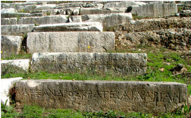
Αποψη των ενεπίγραφων εδωλίων του θεάτρου.

Οι αναλημματικοί τοίχοι των παρόδων, οι οποίοι στήριζαν και συγκρατούσαν το κοίλο, δεν έχουν αποκαλυφθεί πλήρως. Η χωρητικότητα του θεάτρου υπολογίζεται σε 4.000 θεατές.