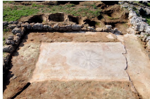
Πρυτανείο-αρχείο. Λεπτομέρεια ψηφιδωτού δαπέδου.