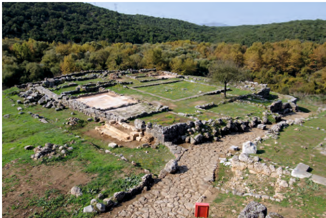
Άποψη του κτηρίου του πρυτανείου - αρχείου.

Στον δυτικό τομέα της πόλης βρίσκονταν τα περισσότερα δημόσια κτήρια, όπως το πρυτανείο-αρχείο, ένας μικρός ναός με σηκό και πρόναο, αφιερωμένος στην Αθηνά Παρθένο, και ευρύχωρο κτήριο με εσωτερική περίστυλη αυλή που προοριζόταν για τη σίτιση δημόσιων προσώπων, ενώ επίσης φιλοξενούσε πιθανότατα στους χώρους του τη λειτουργία νομισματοκοπείου.