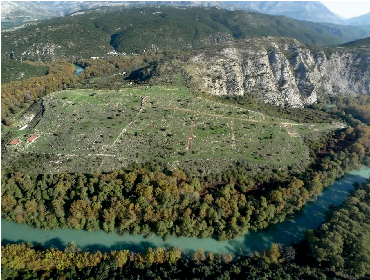
Αεροφωτογραφία αρχαιολογικού χώρου Γιτάνων