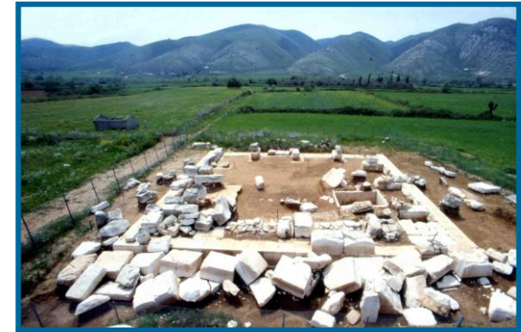
Ταφικό μνημείο στα Μάρμαρα Ζερβοχωρίου

Στους πρόποδες των βουνών της Παραμυθιάς στα βόρεια, αλλά και στα χαμηλότερα βουνά που κλείνουν από νότια την κοιλάδα, παρατηρείται κατά τα τέλη του 4 ου και τις αρχές του 3 ου π.Χ. αι. μία ιδιαίτερα μεγάλη πυκνότητα μικρών οχυρώσεων . Σημαντικότερο από τα κάστρα που αναπτύσσονται ανατολικά της Ελέας -Ασφάκας, Γαρδικίου, Χόικας, Μανδρότοπου, Σκανδάλου- είναι το κάστρο του Αγ. Δονάτου Ζερβοχωρίου . Ο ομώνυμος ναός του προστάτη της Παραμυθιάς φαίνεται ότι χτίστηκε στη θέση ή κοντά σε ένα σημαντικό αρχαίο ιερό, αν κρίνουμε από τα εντοιχισμένα σε αυτόν αρχιτεκτονικά λείψανα.