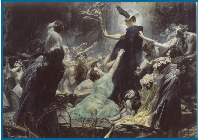
Adolf Hirémy-Hirschl, 1898

Die Seelen des Acheron [Οι Ψυχές του Αχέροντα] Österreichische Galerie [Αυστριακή Πινακοθήκη]