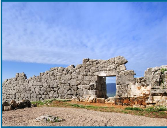
Η ΒΑ πύλη του οικισμού της Ελέας

Στους ιστορικούς χρόνους η περιοχή αποτελούσε τμήμα της αρχαίας Ελεάτιδας, της επικράτειας του φύλου των Ελεατών Θεσπρωτών, με πολιτικό κέντρο τον οχυρωμένο οικισμό της αρχαίας Ελέας , την πρώτη πρωτεύουσα της αρχαίας Θεσπρωτίας και έδρα του Κοινού των Θεσπρωτών από την ίδρυσή της - λίγο πριν τα μέσα του 4 ου π.Χ. αι.- μέχρι και τα τέλη του 4 ου π.Χ. αι.