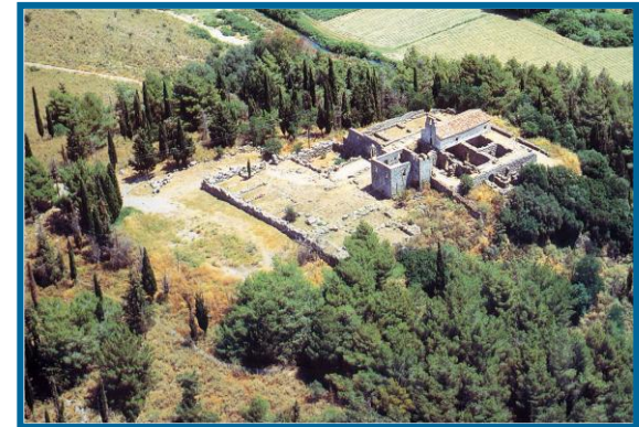
Το Νεκρομαντείο του Αχέροντα

π.Χ., στη βορειοανατολική όχθη της Αχερουσίας λίμνης, το Νεκρομαντείο της Εφύρας , έναν από τους σημαντικότερους χώρους λατρείας των θεών του Κάτω Κόσμου και επικοινωνίας με τους νεκρούς. Εδώ κατέφευγαν, αφού πρώτα υποβάλλονταν σε διαδικασία