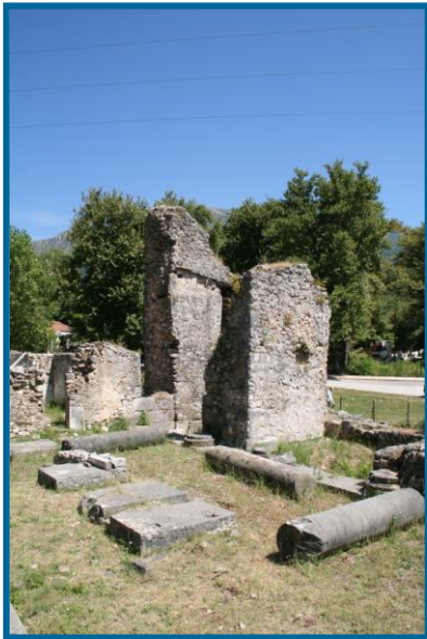
Η τρίκλιτη βασιλική στη Γλυκή

Σε αντίθεση με τη σχετικά πλούσια φιλολογική παράδοση για τη Θεσπρωτία στην αρχαιότητα, οι ιστορικές μαρτυρίες είναι περιορισμένες για την ίδια περιοχή κατά τους βυζαντινούς χρόνους.