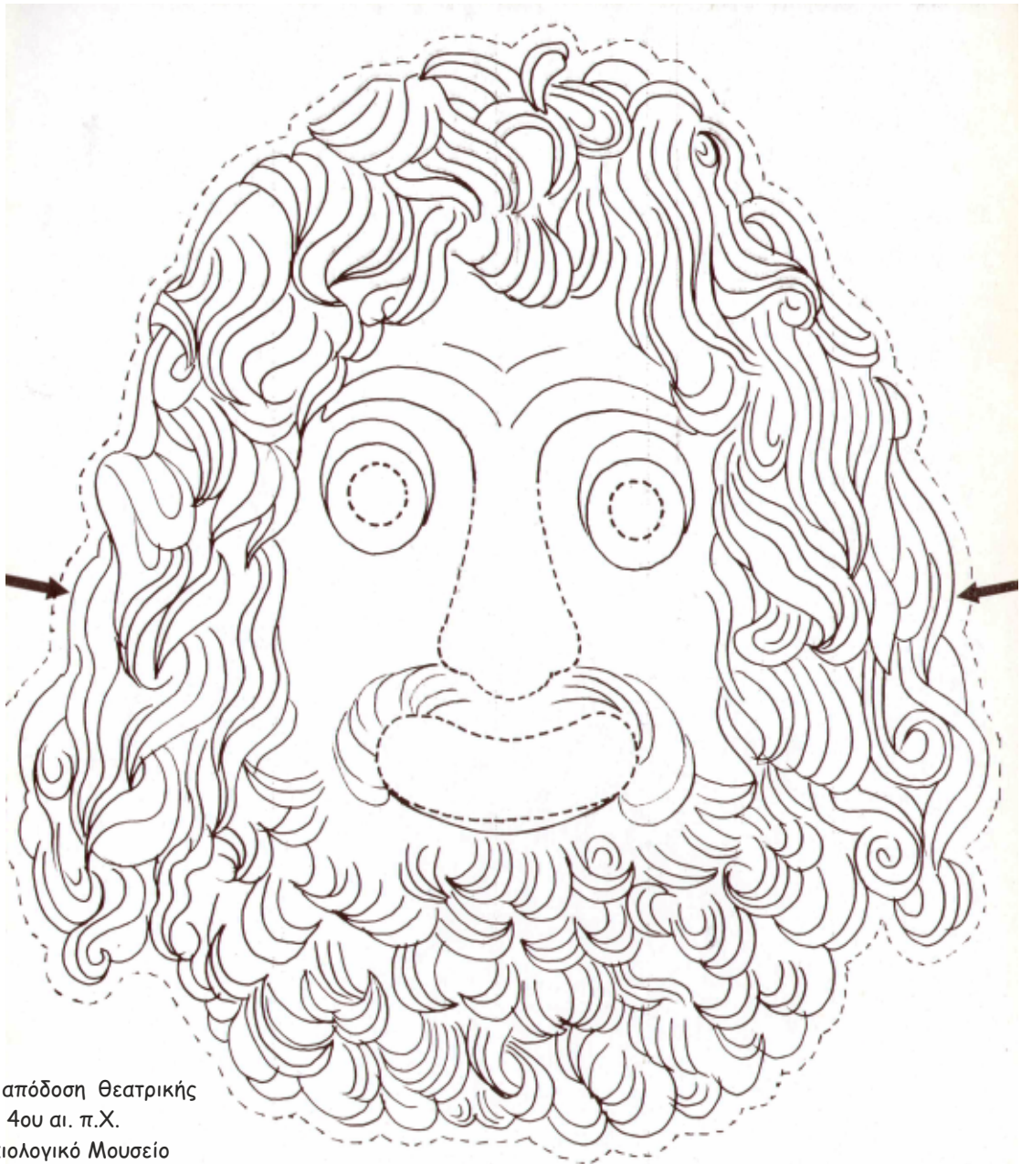
Σχεδιαστική απόδοση Θεατρικής μάσκας, τέλη 4ου αι. π.Χ. Εθνικό Αρχαιολογικό Μουσείο